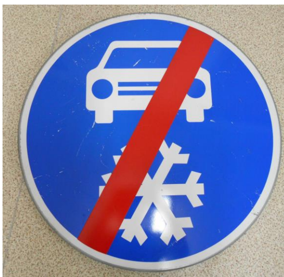
23/2018, 30/2018 - 40.83, 40.91 – dopravní značení (dodatková tabulka a dopravní značka), 70.- 80. léta 20. století, 2016