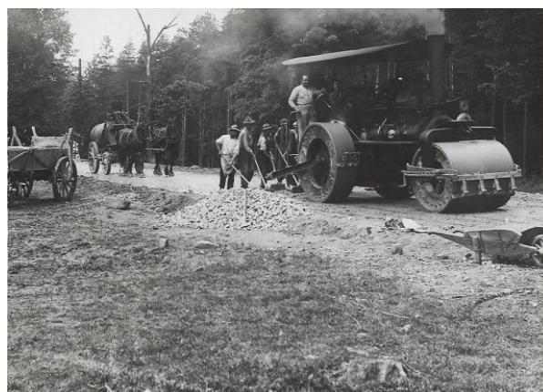
10/2018 - 20.1055, 20.1061 – z kolekce fotografií ze státní silnice „Linická“, 1931 – 1932