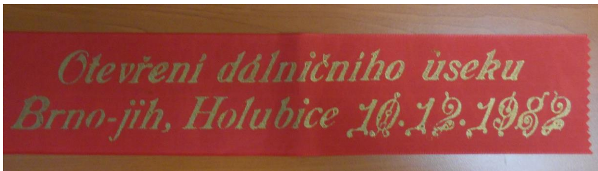
60/2018, 69/2018 - 10.146, 10.155 - pamětní pásy z otevření úseků dálnice D1, 1978, 1982