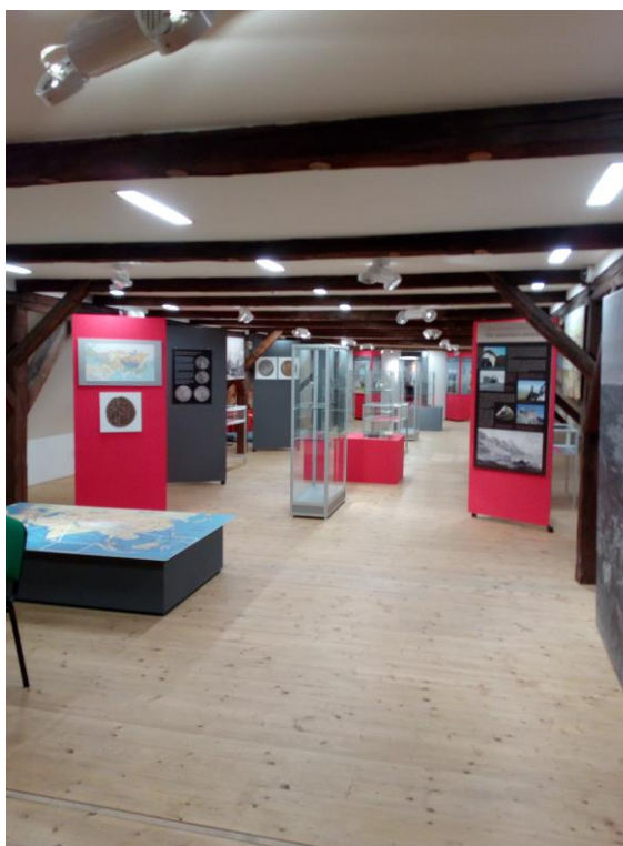
Výstava Mincovní poklady na Hedvábné stezce