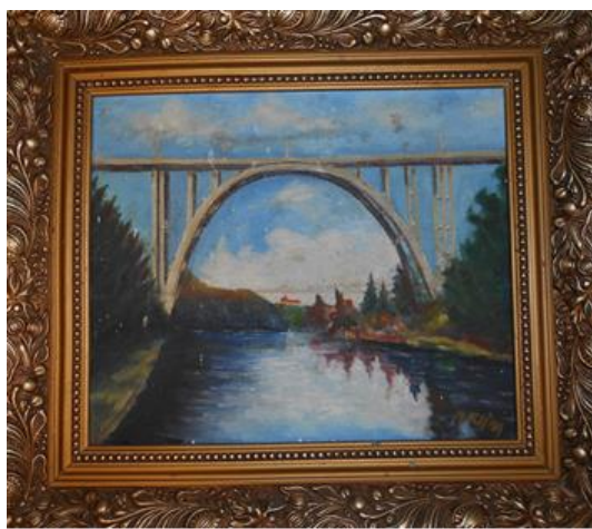
102/2018, 70.88 – štítek s vyobrazením erbu rodiny Kleinů, 9. století (?) 104/2018, 30.825 – obraz Bechyňský most, 2. pol. 20. století