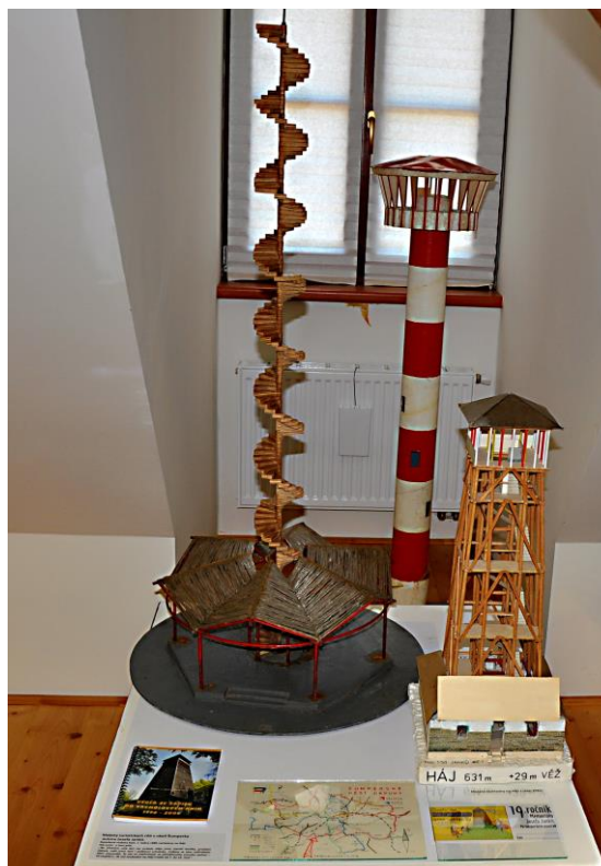
Z výstavy ke 130. výročí Klubu českých turistů