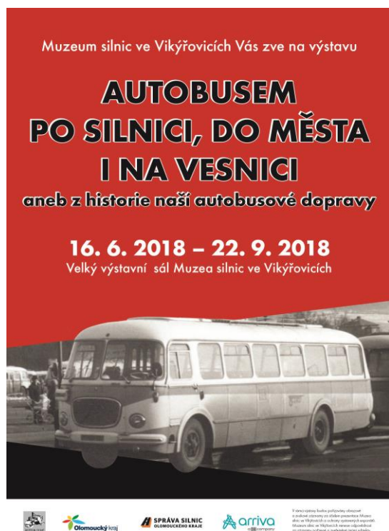
Z výstavy o historii naší Autobusové dopravy