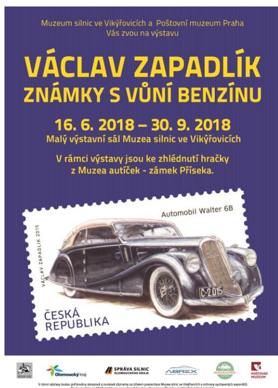
Plakát výstavy poštovních známek V. Zapadlíka (auto – veteráni)