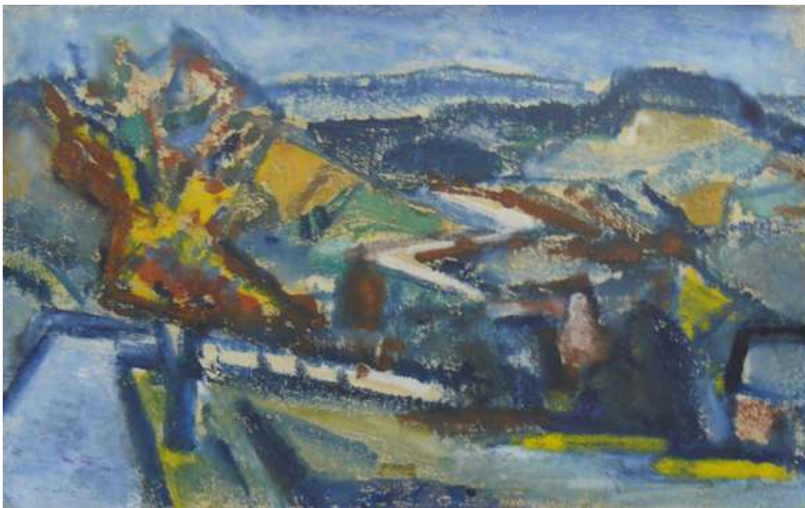
Ak. mal. Lubomír Bartoš – Krajina s cestou II, monotyp, 1971, 9/2022, 30.856