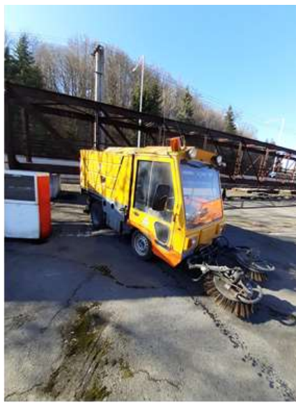
Čistící vůz ČICHO 3, rok výroby 1998, 1/2022, 60.40