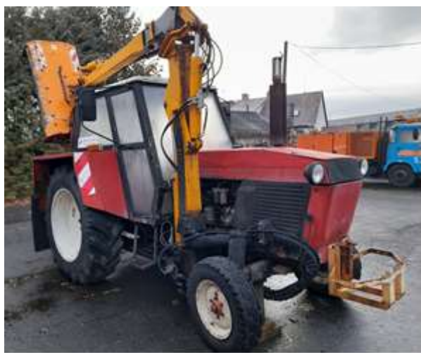
Traktorová sekačka trávy, rok výroby 1978 4/2022, 60.43