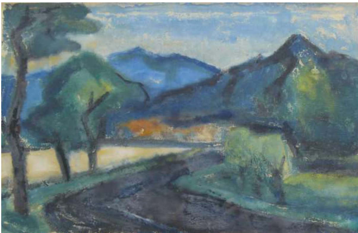
Ak. mal. Lubomír Bartoš – Temenice I, monotyp, 1972, 6/2022, 30. 853