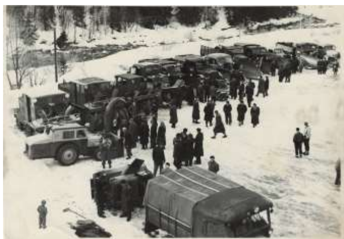
Z kolekce fotografií z přehlídky zimní techniky v Krkonoších – Špindlerově Mlýně, 50. léta, 20. 1222 – 20.1233